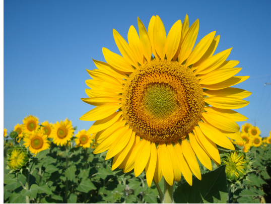
En kærlig sommerhilsen fra en af mine smukke naboer!

Nr. 21, sommeren 2010 – Nyd den! Varme hilsner fra Lisbeth.